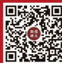
北京信息科技大学勤信研工