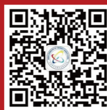
北京信息科技大学研究生教育