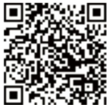
2023级硕士研究生英语分级调查问卷

2023 级研究生英语将实行分级教学(提高班A级、发展班B级)。本次问卷数据将为2023 级研究生入学英语分级主要依据, 请同学们认真填写。如有漏填、错填, 系统将默认为B级。扫码完成问卷截止时间为2023年7月30日。