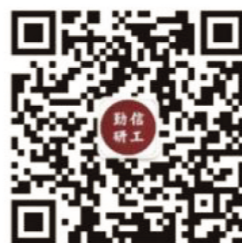
北京信息科技大学勤信研工