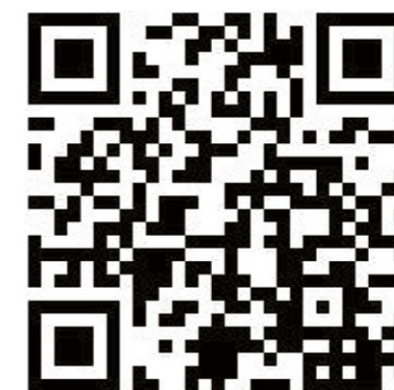
北京信息科技大学研究生新生调查问卷